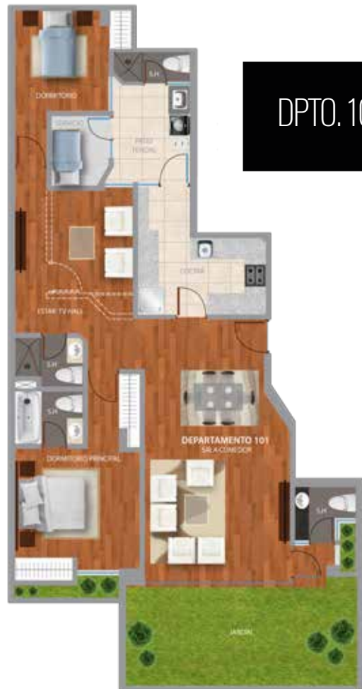
DPTO. 101 Área Total: 142 m 2 .