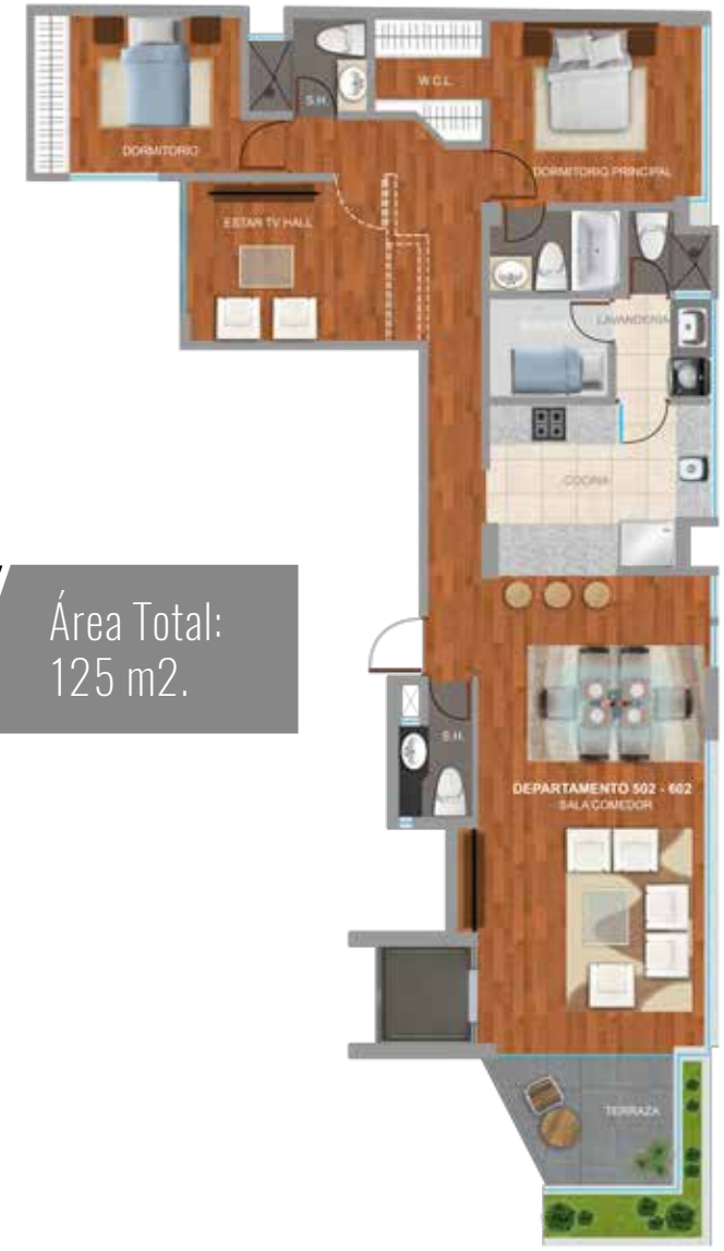
DPTO. 502 - 602 Área Total: 125 m2.