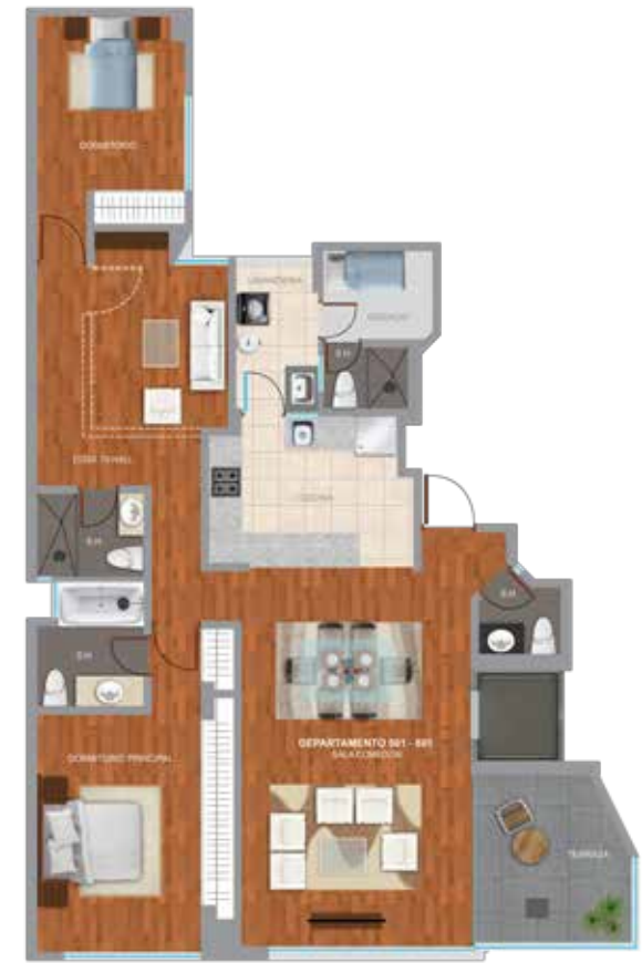
DPTO. 501 - 601 Área Total: 127 m2.