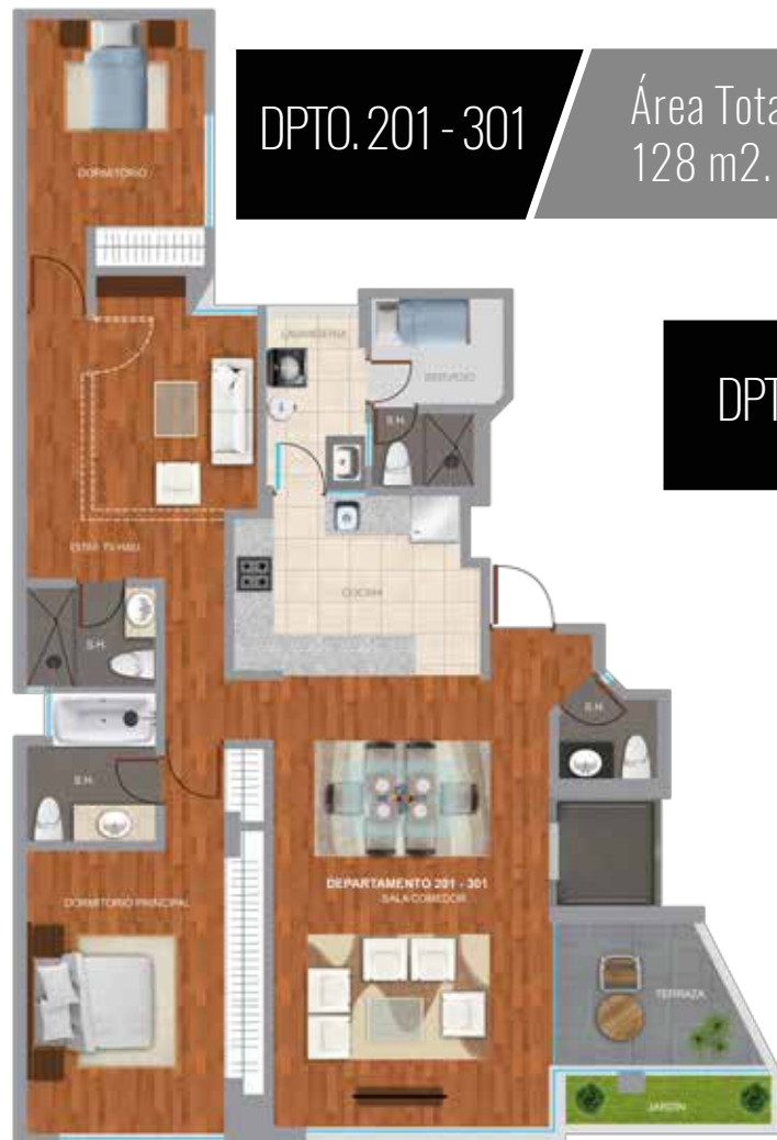
DPTO. 201 - 301 Área Total: 128 m 2 .