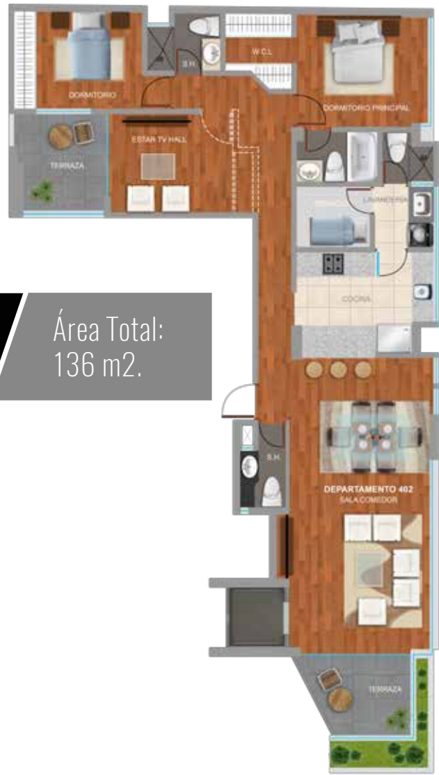
DPTO. 402 Área Total: 136 m2.