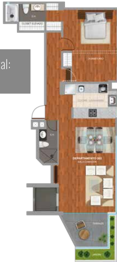
DPTO. 202 Área Total: 90 m 2 .