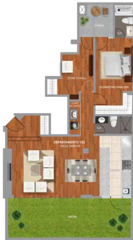
DPTO. 102 Área Total: 120 m 2 .